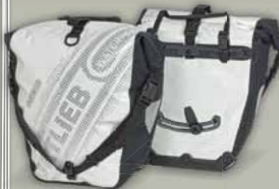
Back-Roller Black'n White